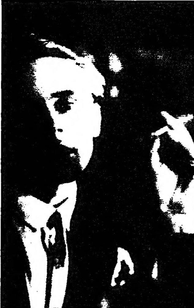
كلاوس مان في عام 1924